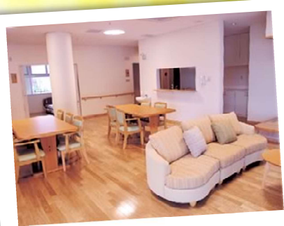
デイホームフロア