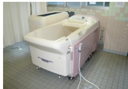
5 機械浴 (寝たまま・座ったままで入浴可能)