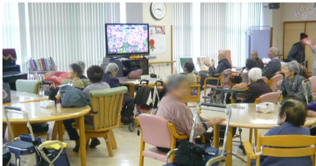
2 デイサービスフロア

ヘルスケアでは、高齢者の“豊かな老後生活の支援”に向けて、安全に留意したサービス提供を行っています。友人との話に花を咲かせたり、一緒に入浴や食事、運動をすることで心身の老化の予防を目指しています。