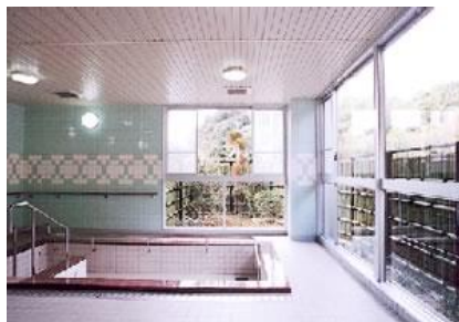
1 浴場 (個別浴槽もあり)