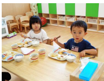
管理栄養士による献立