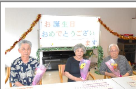
誕生日を迎えられた3名様

また、別の日には暑さを吹き飛ばそう！！ということで、パフェを作りました。トッピングは、アイス、チョコソース、コーンフレーク、生クリーム、みかんです。透明なコップの中に、好きなものを入れながら、「夏じゃから、これがええわ」「美味しい」と喜ばれていました。食後には、「次は、何を作る〜？」と美味しいものの話で盛り上がりました。