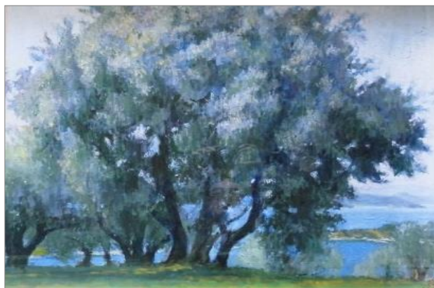
【「オリーブ咲く朝」 F15号（53×65.2cm）2010年作】

ご利用者様やそのご家族、あじさいのスタッフ、その他ご来館される方々も、皆さんその見事さに思わず足を止め、しばらく眺められていらっしゃるお姿を拝見します。